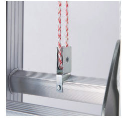
軽い力で伸縮できる専用滑車