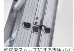
伸縮をスムーズにする専用ガイド