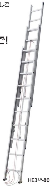
HE3 2.0 -80