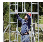
上階用布梯により、先 行して手すりが取付け られ、安全帯をかけ ながら、安全に組立て が可能に。