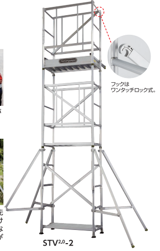
STV 2.0 -2